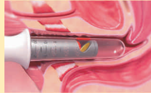
Fotona SMOOTH™ mode treatment of the anterior vaginal wall

ಲೇಸರ್ ಎಂದರೆ ಒಂದು ರೀತಿಯ ವಿಶಿಷ್ಟ ತರಂಗಾಂತರದ ಬೆಳಕು Co2, Erb Yag ಇಂತಹ ಲೇಸರ್‌ಗಳ ಮೂಲಕ ಮುದಿಯಾಗಿರುವ, ಸಡಿಲವಾಗಿರುವ ಅಂಗಾಂಶಗಳನ್ನು ಉತ್ತೇಜಿಸಬಹುದು. ವಿಶಿಷ್ಟವಾದ Vaginal Probe ಗಳ ಮೂಲಕ ಲೇಸರ್ ಅನ್ನು ಸ್ತ್ರೀ ಜನನಾಂಗದಲ್ಲಿ ಹಾಯಿಸಿ ಬಿಗಿ ಬರುವಂತೆ ಮಾಡಬಹುದು.