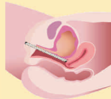
After IncontiLase treatment