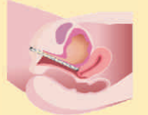
After IncontiLase treatment

ಈ ಚಿಕಿತ್ಸೆಗಳು OPD ಚಿಕಿತ್ಸೆಯಾಗಿದ್ದು 15-20 ನಿಮಿಷಗಳಾಗುತ್ತದೆ. ನೋವಿರುವುದಿಲ್ಲ, ತಕ್ಷಣವೇ ಮನೆಗೆ ಹೋಗಬಹುದು.