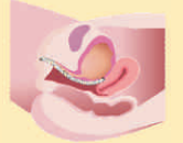
Mild and moderate stress and mixed urinary incontinence